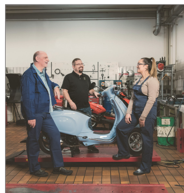
Effizientes Coaching für Lehrlinge Seite 6

4 HILFE FÜR IEHRLINGE Unter der Info-Line 0800 220074 beantworten Lehre-statt-Leere-Coaches Fragen rund um die Lehrausbildung. Österreichweit, gratis und von Montag bis Freitag, 8 bis 18 Uhr. Text Inhalt