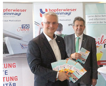
Die Bildungsmeile wurde in Amstetten präsentiert.

4 DIE BILDUNGSMEILE Die 18. Auflage der Lehrlingsinitiative geht heuer in 33 Betrieben in den Bezirken Amstetten und Scheibbs über die Bühne. Die Wirtschaftskammer präsentierte die Veranstaltung bei der Firma Hopferwieser + Steinmayr in Amstetten.