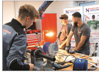
Die neue Hopferwieser+Steinmayr-Lehrwerkstatt ist einzigartig in NÖ und ein Glanzlicht im neuen Amstettner Firmengebäude.